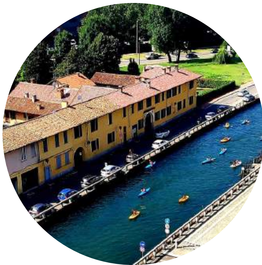
IL NAVIGLIO GRANDE

NAVIGLIOSPORT fonda le sue radici sul Naviglio Grande di Trezzano Sul Naviglio dove trova in esso l'habitat e la filosofia della sua attività sportiva, favorendo la pratica degli sport acquatici di pagaia come la canoa, il kayak, il sup, il rafting, il dragon boat. Unitamente al Naviglio, la seconda base nautica del Lago Mezzetta, sempre a Trezzano Sul Naviglio, rappresenta un punto di riferimento per lo sviluppo delle nostre attività amatoriali, didattiche e agonistiche.