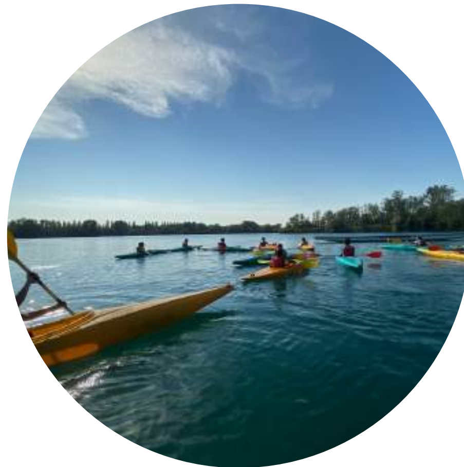
IL LAGO MEZZETTA